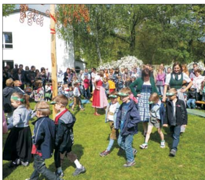
Maibaumfest im Kindergarten