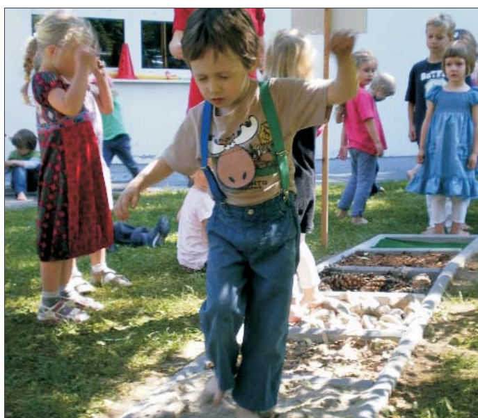
Der neue Barfußweg im Kindergarten Peuerbachstraße