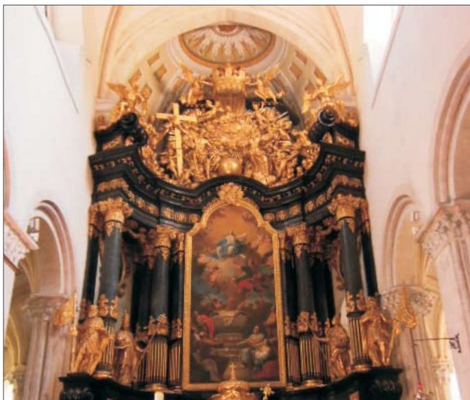
Hochaltar Stiftskirche Lilienfeld