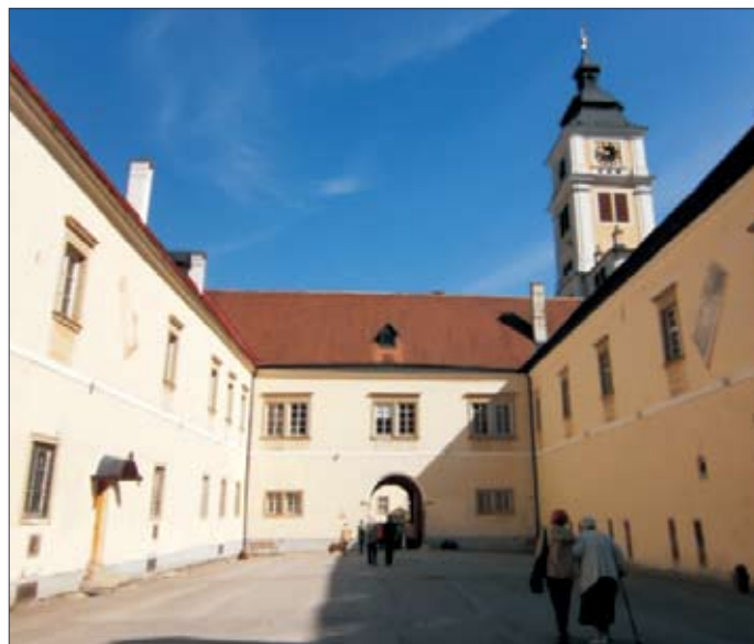
Innenhof Stift Lilienfeld